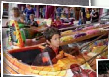
Fête - Inauguration