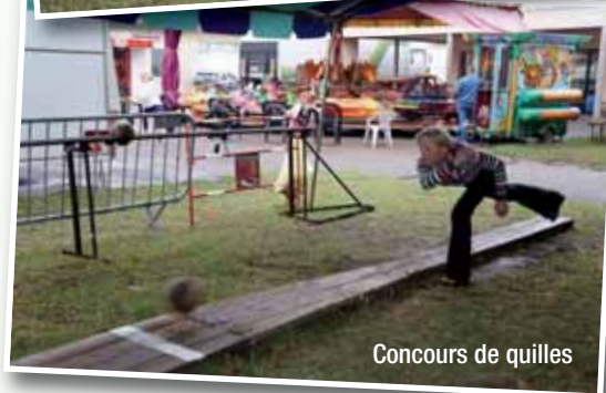
Concours de quilles